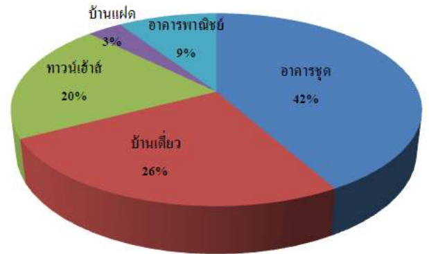
ข้อมูลโอนกรรมสิทธิ์ที่อยู่อาศัย กรุงเทพฯ-ปริมณฑล แสดงจำนวนหน่วยและมูลค่าแยกประเภท รายไตรมาส